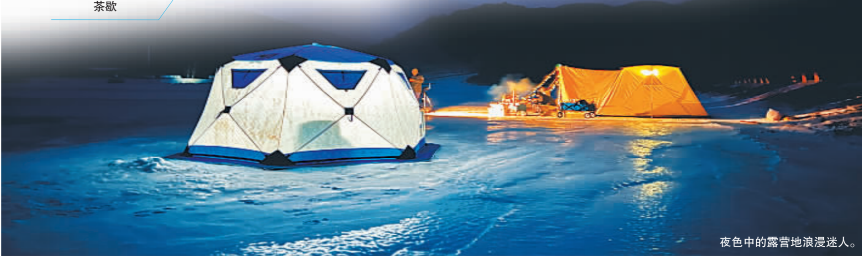
夜色中的露营地浪漫迷人。