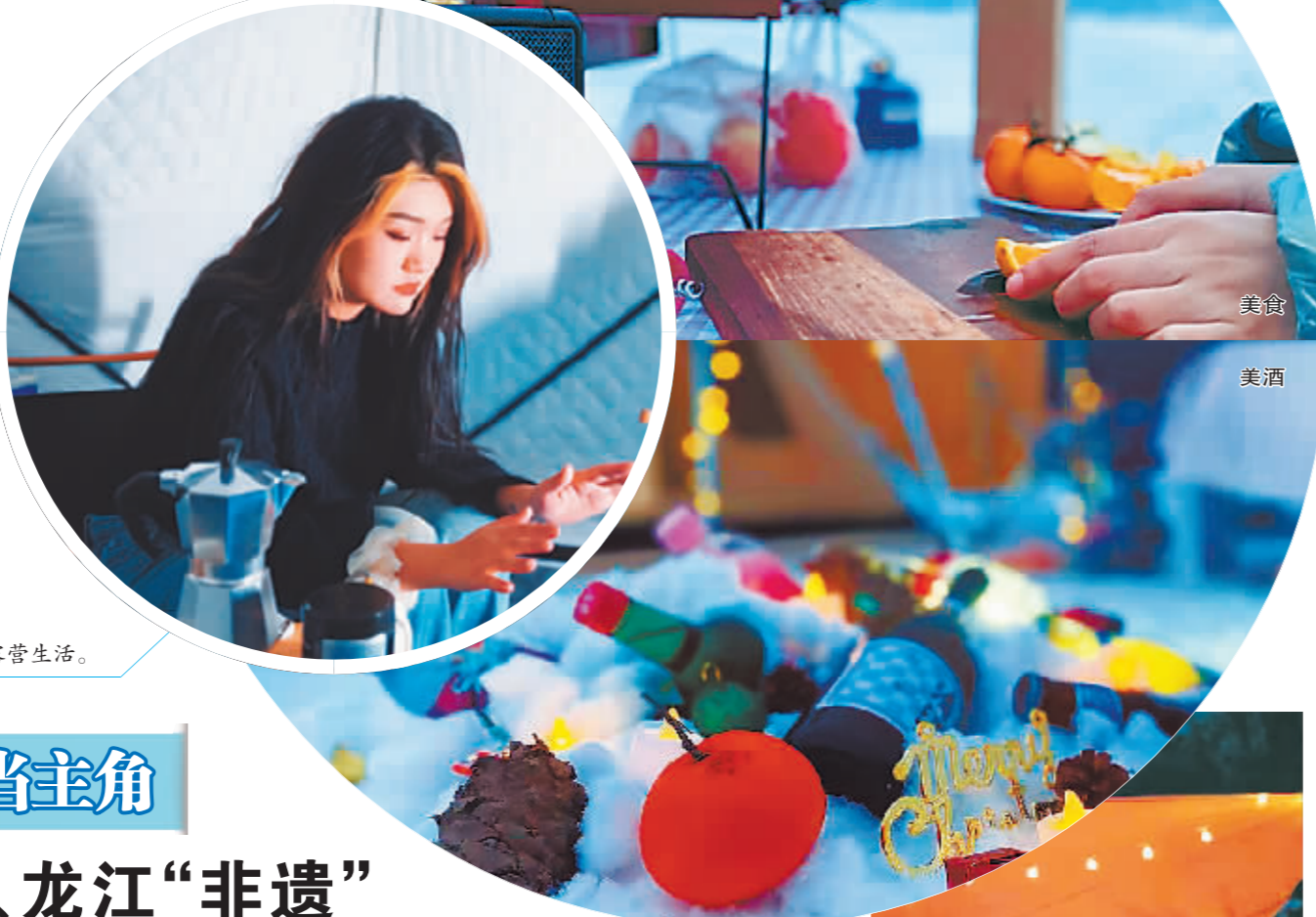
游客在帐篷中享受露营生活。

钓就是其中一项。 在冰钓基础上,热爱比较刺激的冰雪运动的可以参加冰雪漂移、冰雪露营;对于爱美的女士可以参加户外美拍、篝火晚会等项目;针对中小学生的,可以参与户外研学、亲子活动等,既可以打散单独体验,也可以整合一站式体验。“参与者不仅能亲身体会,还能掌握户外生存技能。”崔连波说,比如在雪地穿越中,变身猎手,跟随老猎人的脚步,上山寻觅野兽的踪迹,同时翻山越岭,感受与众不同的冰雪体验。