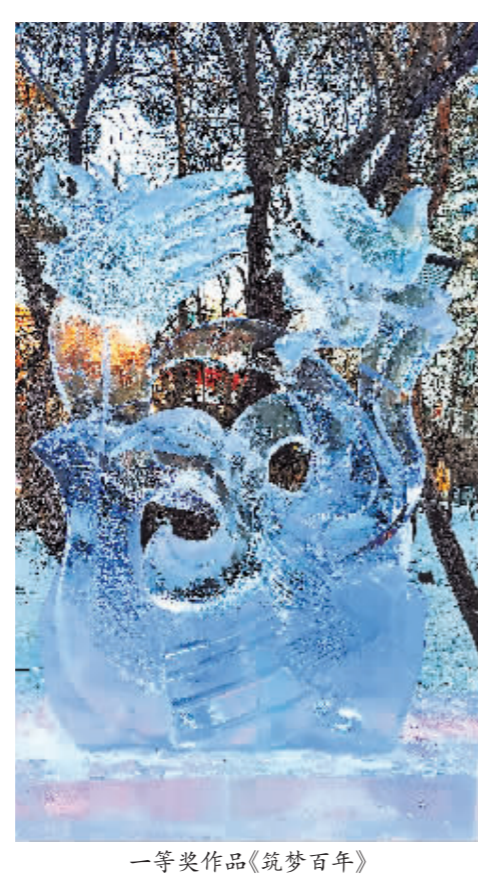
一等奖作品《筑梦百年》

全国青年专业冰雕比赛落幕 本报讯(记者 张鸣霄文/摄)经过3天紧张激烈的角逐,以“迎冬奥·创未来”为主题的第二届“华德杯”全国青年专业冰雕比赛,于1月4日在兆麟公园落下帷幕。清友队作品《筑梦百年》荣获一等奖,全球冰雪队作品《乘风破浪》和鸿洋文化队作品《银杏叶下的凤凰》获得二等奖。 荣获本届冰雕比赛一等奖的清友队是由市残联和“鸿艺青年冰雪新人培养计划”联合选送的一支残疾人队伍,两名参赛选手分别患有视野障碍和语言表达障碍。虽然创作冰雕作品的过程对于他们有着异于常人的困难和艰辛,但对冰雪艺术和美好生活的热爱让他们沉醉创作,收获佳绩。 兆麟公园冰灯游园会作为中国冰灯艺术的发源地,不仅见证了中国冰灯的发展历史,也为中国乃至世界培养了一批又一批冰雪艺术人才。此次比赛让更多的残障人士融入到冰雪行业中来,使其参与社会活动的方式更多元化,为冰雪艺术输送了大批人才,繁荣了哈尔滨冰雪产业。