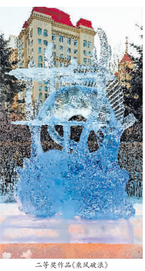
二等奖作品《乘风破浪》