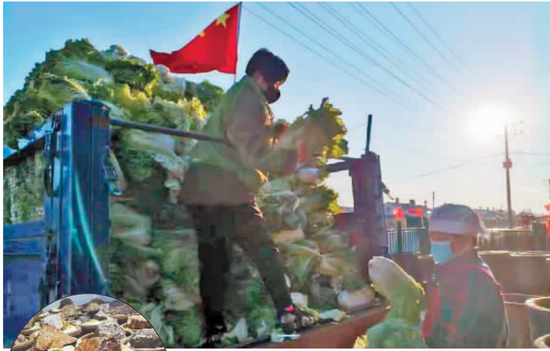
上图:乡亲们将原料白菜从车上卸下来。 左图:装满腌菜的大缸承载着致富希望。

入冬了,巴彦县万发镇北兴村的乡亲们格外忙碌,乡亲们腌制的酸菜通过线上销售卖往全国,年销量突破了15吨。择菜、装缸、腌菜成了乡亲们的日常。农家院的大白菜“华丽转身”,闯开了一条增收致富路。