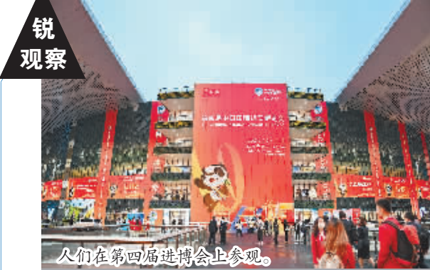
人们在第四届进博会上参观。