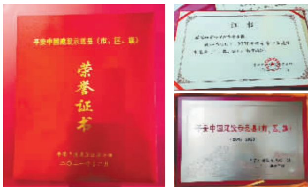
平房区被评为“2017—2020年度平安中国建设示范县(区)”。

全面推行“一照九证”全程电子化和“政银合作”,实行“只进一扇门,办事不求人”和“不见面”登记。全面推行企业名称自主申报服务,减少企业名称登记环节,有效缩短企业设立登记时间。