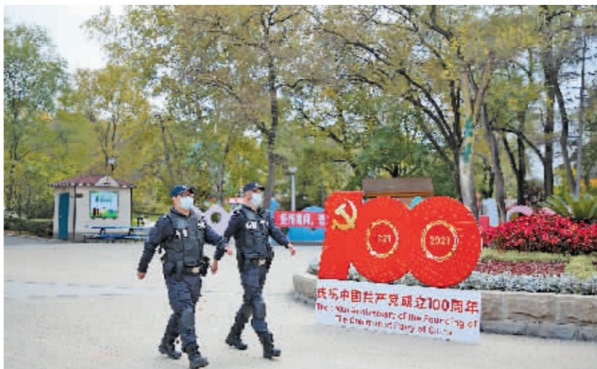
加强街面巡逻处处见警。