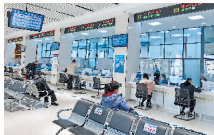
在全省率先建立智能化标准化数字化政务服务窗口一体运行机制。

“让信息多跑路,才能让群众少跑腿”。平房区强化以群众满意为导向,在全省率先建立智能化标准化数字化政务服务窗口一体运行机制,构建“3+10”政务服务体系,着力打造新时代法治化营商环境“平房范本”。