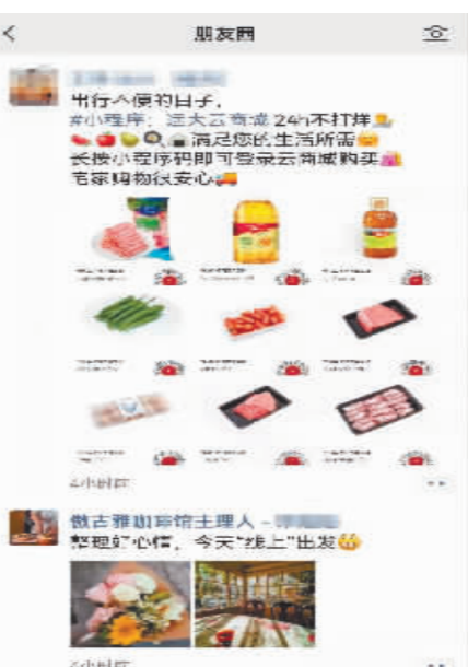
▲商家线上服务的朋友圈截图。 ▲工作人员为商品消毒。