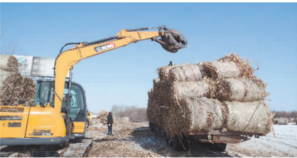
秸秆打包离田,变废为宝。

秋收过后,颗粒归仓,秸秆处理又成了冰城田野的大事。过去,大量秸秆被一烧了之,既是一种浪费,更给生态环境带来沉重负担。如今,秸秆已成为“抢手货”。2020年,哈市统筹推进蓝天、碧水、净土保卫战,秸秆综合利用率达90%。