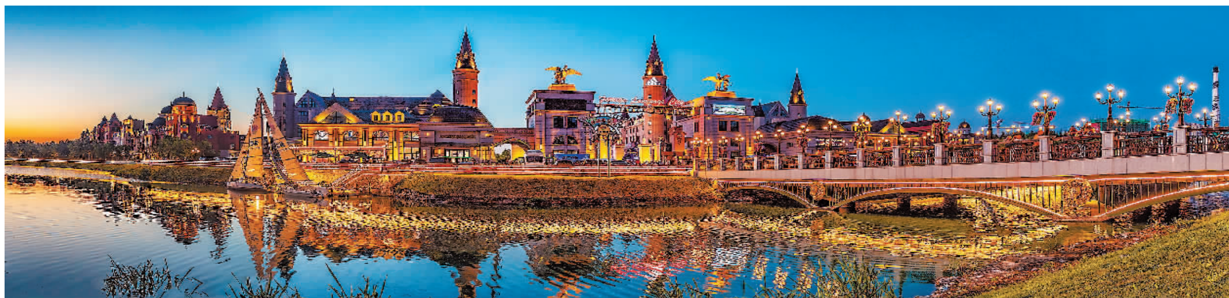
美轮美奂的世界欢乐城。

程。统筹做好重点群体就业工作。提升社区服务网络化、智能化水平。坚决守好疫情防控底线,安全生产红线和社会稳定底线,常态化推进扫黑除恶,妥善解决群众合理诉求。深入开展“我与新区共奋斗、同成长”活动。