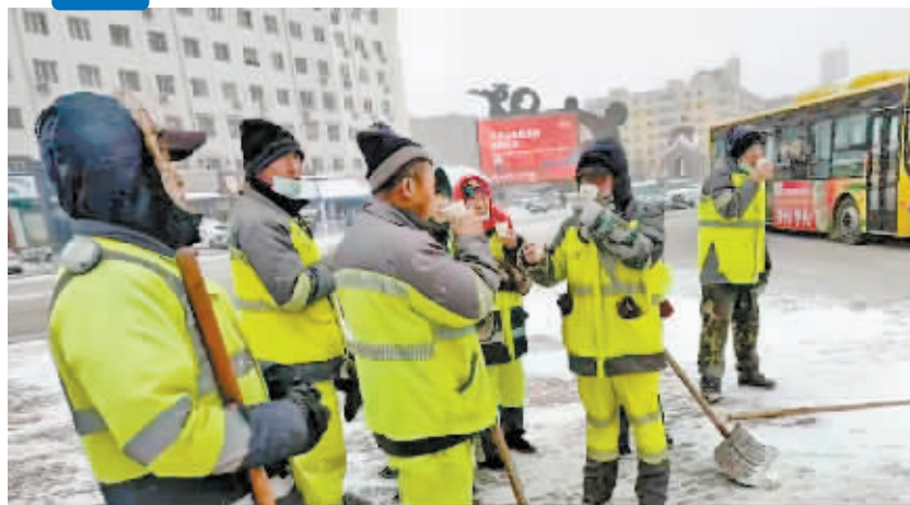
爱心企业送来热豆浆。

本报讯(孙滨 记者 杜菲菲)“为了市民出行安全、道路畅通,你们辛苦了!请喝杯热饮暖暖身吧!”11月22日,热心人士将一杯杯饱含温暖的热豆浆、奶茶送到道外区清冰雪作业一线的环卫工人手中。