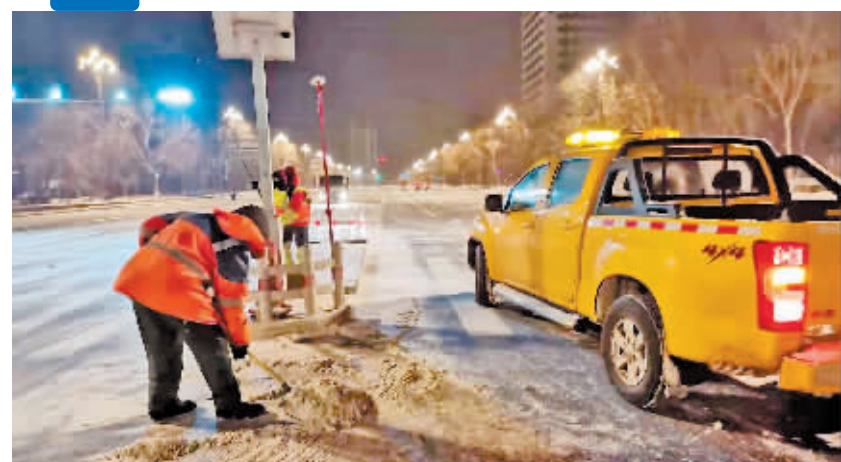
清冰雪人员对重点部位加细作业。

本报讯(记者 刘姝媛 霍亮 文/摄)为确保市民出行安全顺畅,香坊区清冰雪人员在确保主干路积雪及时清运的基础上,重点对辖区人行道、公交站点、交通信号、人行天桥等部位展开提标加细作业。