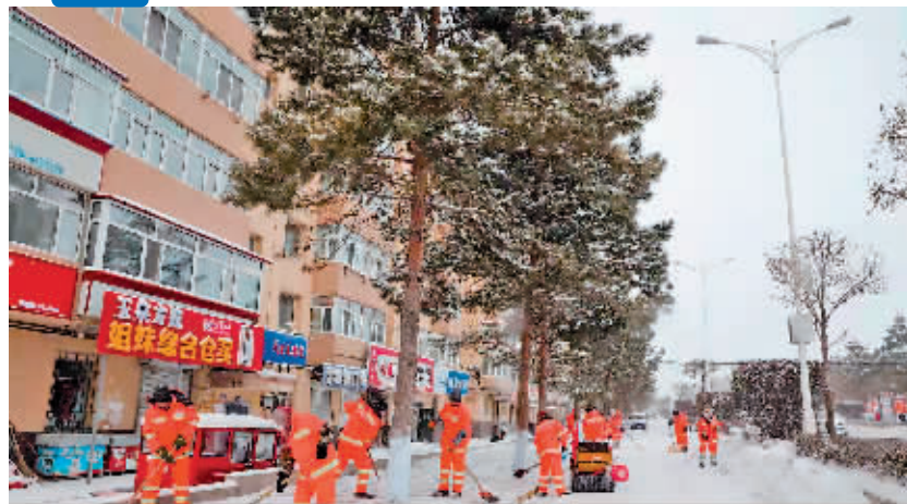
清冰雪人员加细收尾。

本报讯(李丽艳 记者 梁可心)11月21日夜间,我市迎来降雪天气,平房区城管局提前研判,及时向全区发布紧急通告,提示市民加强防范,积极应对暴雪天气,做到工作动员部署到位、机械化清雪安排到位、后勤保障到位,各清冰雪作业单位昼夜奋战,坚决完成“保安全、保畅通”清冰雪任务。