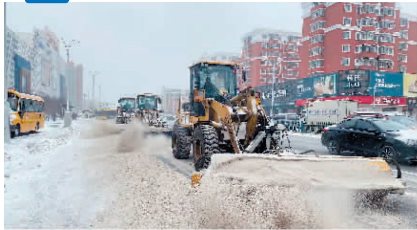
清运结合高效作业。

本报讯(柏凡露 记者 梁可心 文/摄)11月21日晚,哈市再降大雪,南岗区按照“提前部署,边下边清,连续作战”的原则,根据街路实际情况,及时调整工作思路,科学组织机械、人力,所有机械、车辆和作业人员“雪”奋战32小时,实现“保交通、保民生、保环境、保安全”目标。