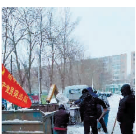
临街商户和志愿者全力清冰雪。

本报讯(记者 霍亮 文/摄)香坊各街道、社区街道和执法部门积极动员沿街商户自扫门前雪,辖区9000余沿街商户单位响应号召,积极清理门前积雪。