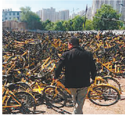
回收的共享单车集中堆放在一起。

税务部门通过税收大数据分析，还发现其他个别网络主播在文娱领域税收综合治理中自查自纠不到位，存在涉嫌偷逃税行为，正由属地税务机关依法进行稽查。