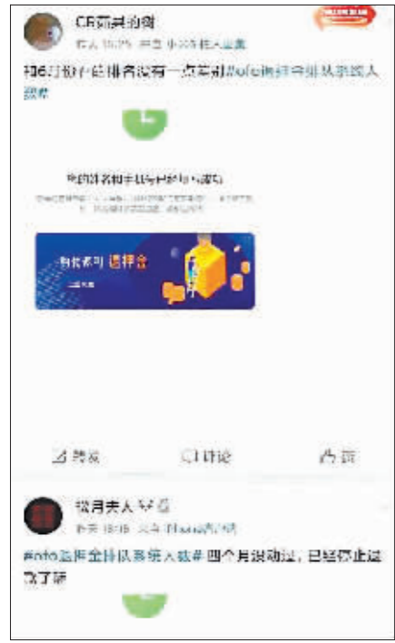
微博用户反映退押金排队数月不动。

盘和林认为，ofo 应该受到监管。一方面，其押金不退的问题本身就是违规，需要对其资金进行监管，防止其挪用资金用于他途。另一方面，当前隐私保护、数据安全的大背景下，平台规则修改需要监管。即使 ofo 进入电商领域，其资金状况是否有能力保障买卖双方交易正常进行？所以，也需要监管。