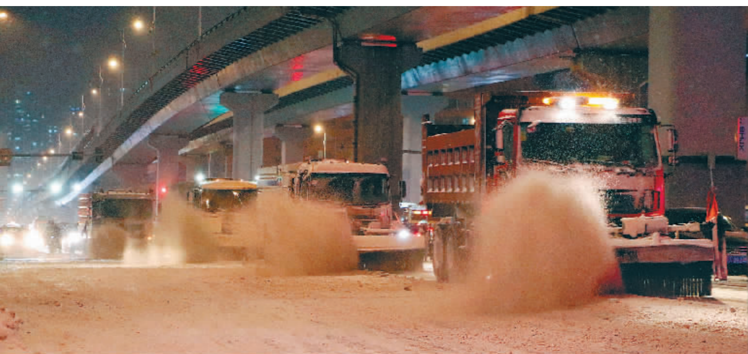
右图:环卫作业车辆在南岗区宣化街桥下清冰雪。

洞补短板,全面消除各类风险隐患。他要求,值班值守人员要在岗在位,履职尽责,保证24小时视频调度和通信联络顺畅。全面落实灾害防范属地责任,做到以雪为令,不等不靠,自动响应,各级领导干部要靠前指挥,周密部署,不断提高灾害防范决策、应急处置能力,坚决打好打赢抗击暴雪灾害攻坚战。