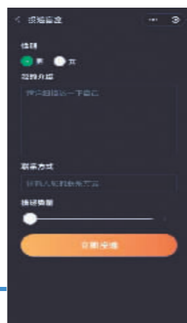
截图自某脱单盲盒小程序。