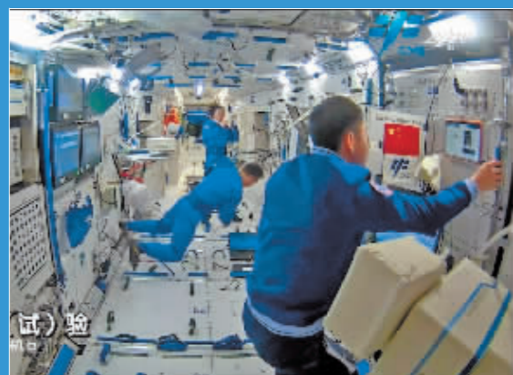
中国载人航天官方网站视频截图,神十三乘组进行在轨科学实验(试)验。