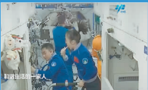
航天员在进行个人清洁。