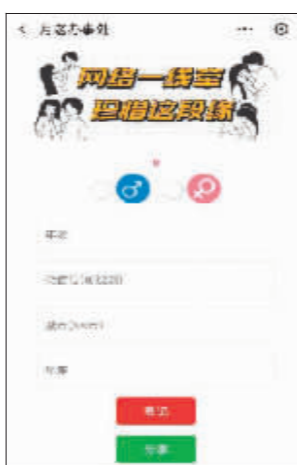
截图自某月老办事处小程序。