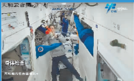
航天员王亚平在进行身体检查。