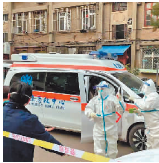
工作人员对涉疫收件人住所单元暂时封闭。

多地疾控部门提醒:疫情防控期间,非必要不要从境外高风险地区网购商品,谨慎网购国内有本土疫情报告所在地区的商品。