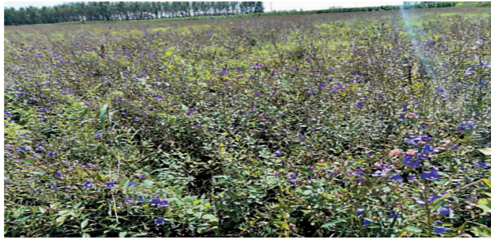
中药材种植规模不断扩大。(资料片)

乡村振兴的重中之重是产业兴旺,只有产业兴旺,农民收入才能持续稳定增长。阿城区利用辖区内多山的地域特点,大力发展中药材产业,