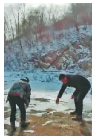
工作人员设置鸟类投食点。

为应对暴雪冻雨极端天气对野生动物,特别是鸟类觅食造成的不利影响,有效保护鸟类资源,阿城区林草局积极组织各国有林场,在施业区内鸟类聚集地有序开展投食喂食活动,每个单位设置2个以上投食点,食物以麻籽、谷子、高粱、玉米、胡萝卜等为主。同时,加强重点区域巡查巡护工