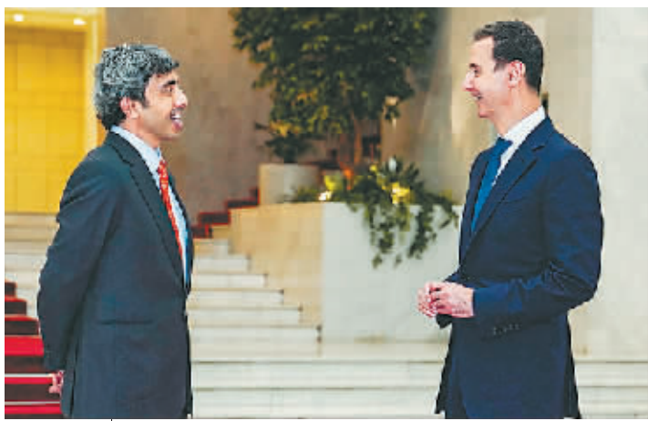
巴沙尔会见阿盟首脑。