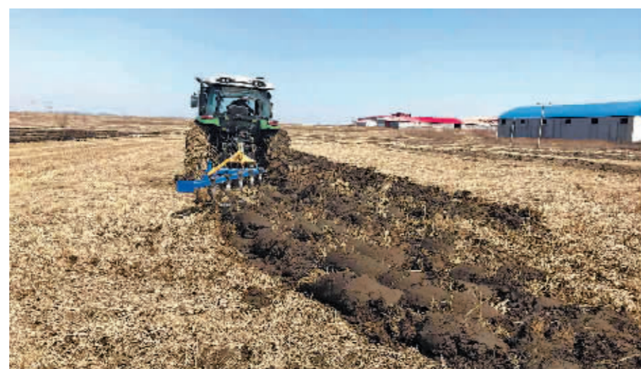
秋收后深翻作业保护黑土地。

的不良影响。减化肥、减农药、减除草剂,一场“三减”行动正在冰城乡村深入实施,引领绿色优质农业发展,更好地保护黑土地。