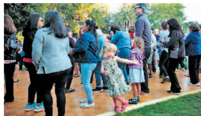
7月22日,一名儿童在美国旧金山湾区城市圣马特奥的中央公园举办的露天音乐会上玩耍。

新华社北京11月4日电 随着美国新冠疫苗接种年龄范围进一步扩大,旧金山市打算要求可接种疫苗的5岁至11岁儿童,凭接种证明进入餐馆、健身房等室内公共场所。旧金山8月起要求12岁以上群体在进入某些室内公共场所前出示新冠疫苗接种证明,成为美国首个发布这类规定的大城市。美国疾病控制和预防中心2日正式建议,把辉瑞新冠疫苗使用范围扩大至5岁至11岁儿童。这一年龄段儿童同样接种两剂疫苗,间隔21天。据《旧金山纪事报》3日报道,旧金山卫生官员苏珊·菲利普说,5岁至11岁儿童完成新冠疫苗全程接种后,凭接种证明进入某些室内公共场所的要求也将扩大至这一群体。全程接种指完成两剂接种后再过两周。菲利普说,这一强制措施在两个月内不会启动。“我们当然想等一等,确保孩子们有机会打上疫苗。”