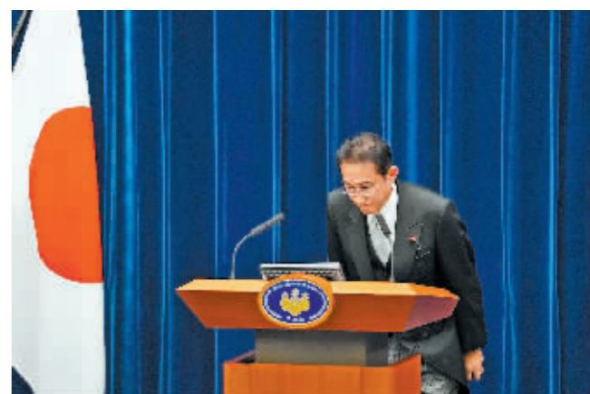
10月4日,日本首相岸田在首相官邸召开记者会。

新华社北京11月4日电 日本首相岸田文雄4日说,他将在组建新一届内阁内兼任外务大臣。现任外相茂木敏充将出任自由民主党干事长。据共同社报道,岸田领导的自民党已提名茂木任干事长,接替在国会众议院选举中意外落败而请辞的甘利明。岸田4日说:“新内阁组建前,我考虑兼任外务大臣。”日本众议院定于10日举行首相指名选举,自民党及其执政盟友公明党占据多数席位,预计岸田将当选第101任首相,随后,将组建新内阁。据路透社报道,除外相一职,新内阁可能不会有太大变动。一名知情人士告诉共同社记者,前文部科学大臣林芳正有望出任外相。自民党10月31日赢得国会众议院选举,所获议席好于选前预期,但丢掉部分席位。时任干事长甘利明在小选区意外落败,不堪其辱而请辞。作为自民党重量级人物,他担任这一“二把手”职务仅一个月。岸田此次兼任外相意味着将重操旧业。前首相安倍晋三执政期间,岸田执掌外务省四年半,是日本自第二次世界大战结束以来连续在任时间最长的外相。