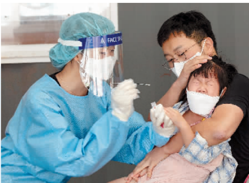
9月18日,在韩国首尔火车站附近,一名医护人员给一个小朋友做核酸采样。

新华社北京11月4日电 韩国中央防疫对策本部3日通报,韩国前一日新增新冠确诊病例超过2600例,创一个多月以来新高。两天前,韩国刚迈出“解封”第一步,放宽一系列防疫限制措施,以期分阶段恢复日常生活。防疫部门警告,随着防疫限制措施的放宽,餐厅和酒吧在万圣节期间人满为患,群体性感染风险增高,新增病例数恐将进一步攀升。根据中央防疫对策本部的数据,韩国2日新增确诊病例2667例,较前一日新增1589例增加1000多例。这是9月30日以来,韩国单日新增病例数首次突破2500例,同时是韩国新冠疫情暴发以来的第四高单日数值。韩国行政安全部长官全海澈3日在了一场疫情相关会议上说:“近期新增病例中,超过24%是青少年。人们越来越担忧,学校、培训班等教育机构将更频繁地发生新的群体性感染。”韩国最近开始为青少年群体接种疫苗。目前,12至17岁群体疫苗接种率仅为0.6%。根据韩国政府发布的“分阶段恢复日常生活”路线图,全国所有学校将于22日完全恢复正常教学。这一