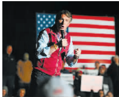
扬金11月1日参加竞选造势。(资料图)

美国弗吉尼亚州2日举行州长选举。据美联社报道,共和党候选人、政坛新人格伦·扬金打败民主党对手、政坛老将麦考利夫,赢得州长选举,实现翻盘。他也是自2009年以来第一位赢得该州州长选举的共和党人。弗吉尼亚州和新泽西州是美国少数在总统大选次年举行州长选举的州。目前,这两个州的州长均为民主党人。扬金现年54岁,曾是一名私募投资集团高管,拥有25年的金融投资经历,在竞选州长前并无从政经验。而麦考利夫是政坛“老将”,曾于2014年至2018年当选过弗吉尼亚州长。美国《纽约时报》指出,扬金的胜利向共和党展示了如何利用拜登的弱点并避开特朗普的阴影。