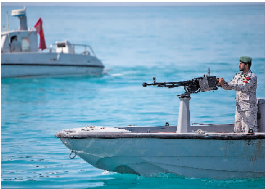
2019年4月30日,伊朗士兵在霍尔木兹海峡巡逻。

新华社北京11月4日电 伊朗官方媒体3日报道称,伊朗海军在阿曼湾挫败了美国海军“盗窃”伊朗出口石油的行动。伊斯兰革命卫队表示,将很快发布有关美方这一“海盗行径”的录像。按伊朗媒体的说法,美国海军在阿曼湾拦截一艘运载伊朗出口石油的油轮,企图“盗走”这批石油,而伊朗伊斯兰革命卫队海军出动直升机,控制住油轮,把它导向伊朗领海。报道说,美军随后出动数架直升机和数艘军舰,企图再次截住油轮,但以失败告终。油轮目前已在伊朗领海。阿曼湾位于伊朗以南,阿曼以北,是连接阿拉伯海和霍尔木兹海峡的海湾。不过,报道中没有提及这起事件发生的时间。美国政府尚未就伊朗媒体的报道发表评论。美伊就恢复履行伊朗核问题全面协议的谈判陷入停滞。伊朗最高国家安全委员会秘书阿里·沙姆哈尼3日早些时候在社交媒体推特发文:“缺乏权威的美国总统(约瑟夫·拜登)没准备好给出保证。如果现状继续下去,谈判结果是清楚的。”