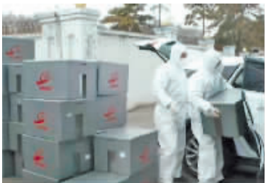
为隔离人员配送盒饭。

水果,每份水果品种多样。在医疗保障方面,哈飞先期为职工配备基础类药物,后期在符合疫情防控要求前提下,为职工搭建购药平台,便于职工按需及时购药。