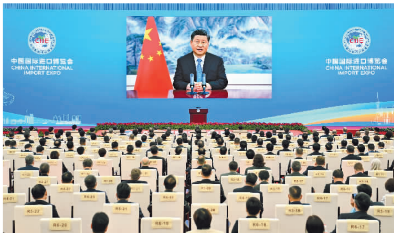
11月4日晚,国家主席习近平以视频方式出席第四届中国国际进口博览会开幕式并发表题为《让开放的春风温暖世界》的主旨演讲。

新华社北京11月4日电 11月4日晚,国家主席习近平以视频方式出席第四届中国国际进口博览会开幕式并发表题为《让开放的春风温暖世界》的主旨演讲。