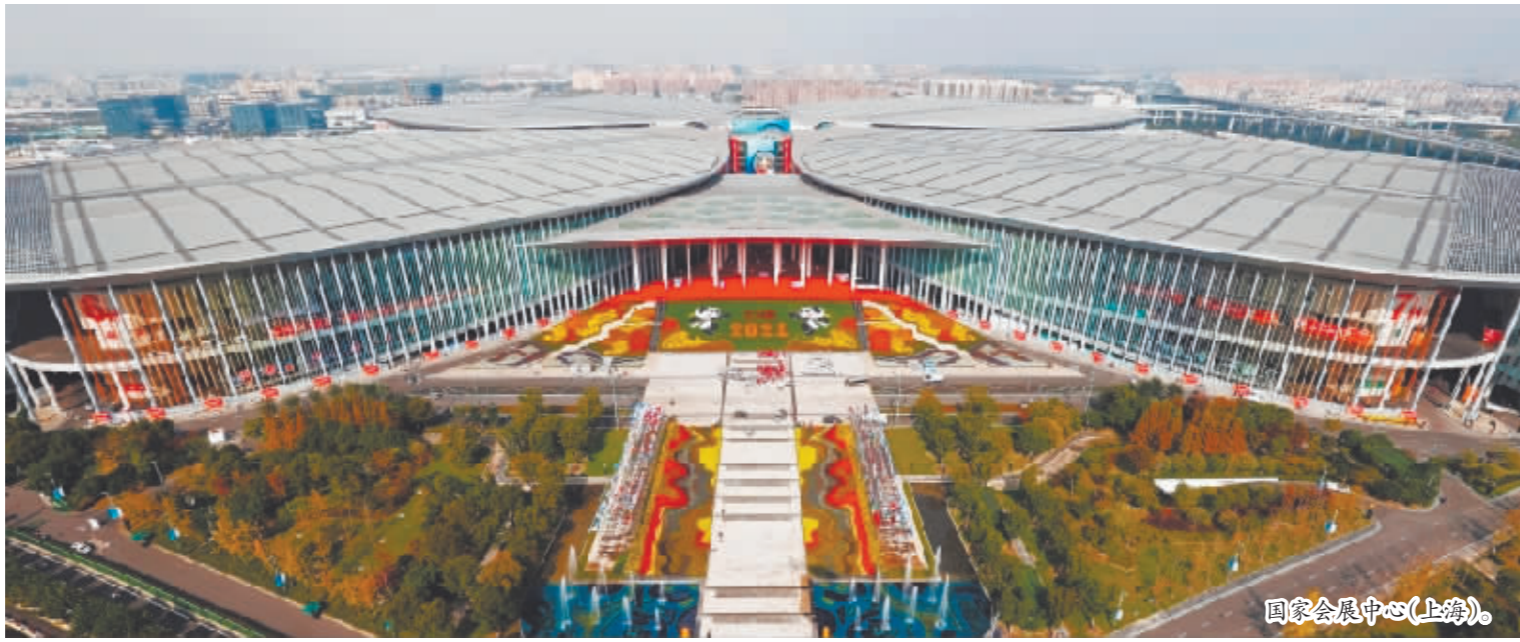
国家会展中心(上海)。

第四届中国国际进口博览会即将在上海拉开帷幕。2021年是“十四五”开局之年,也是中国加入世贸组织(WTO)20周年。在重要时间节点举办的第四届进博会新在哪里?释放出哪些信号?如何更“进”一步?记者带你先睹为快。