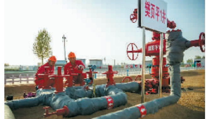
工作人员在查看樊平1井生产运行情况。

据新华社11月2日电 记者从中国石化胜利油田获悉,胜利油田济阳页岩油勘探多点开花,首批上报预测石油地质储量4.58亿吨,已具备全面勘探开发条件。