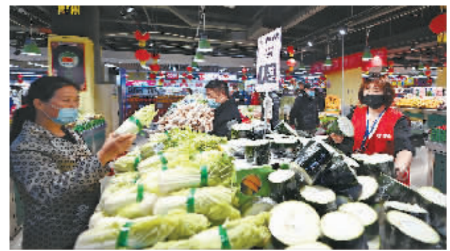
顾客在超市选购蔬菜。

央视网消息 商务部近日印发的《关于做好今冬明春蔬菜等生活必需品市场保供稳价工作的通知》中提到,“鼓励家庭根据需要储存一定数量的生活必需品,满足日常生活和突发情况的需要”,这句话引发关注,存在一些过度解读的现象。2日,商务部消费促进司负责人接受记者采访时对此作出了回应。商务部消费促进司司长朱小良表示,从目前的情况来看,各地生活物资货源充足,供应完全有保障。商务部专门印发了通知,目的在于督促各地严格落实“菜篮子”市长负责制,指导商贸流通企业加强货源组织,畅通产销衔接,提前采购耐储蔬菜,与基地签订蔬菜供货协议。