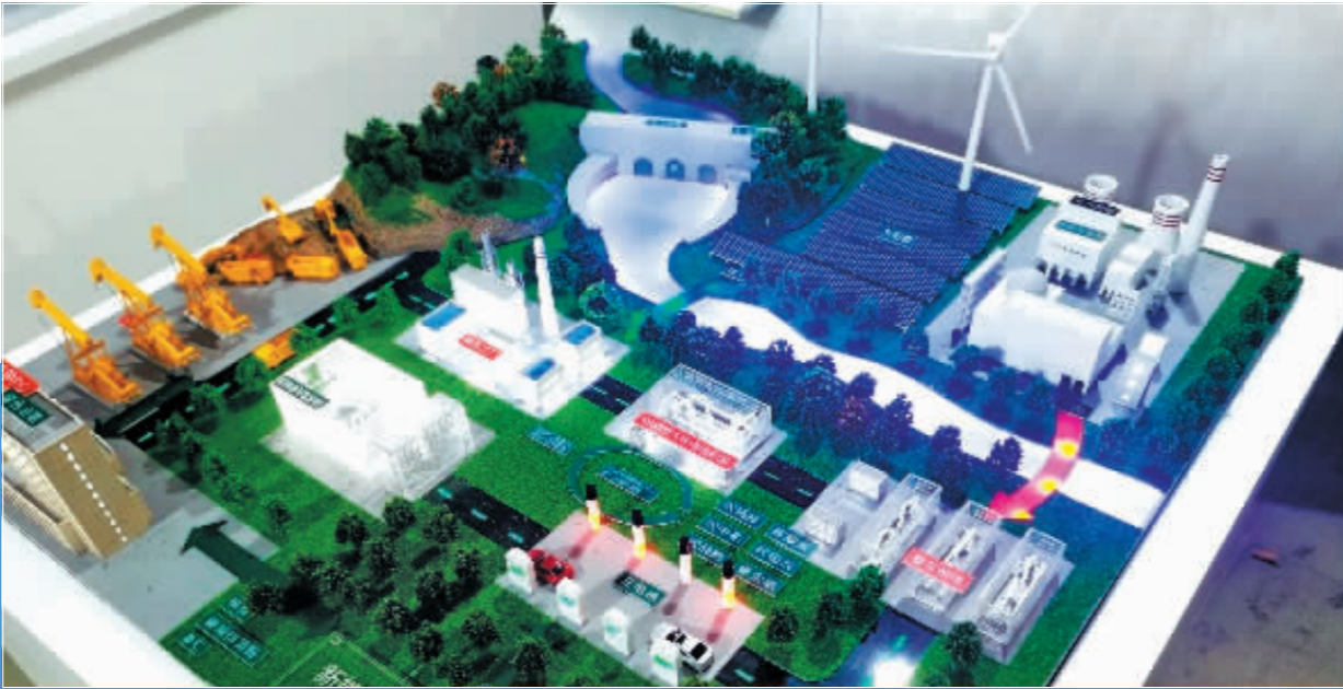
SGS 新能源汽车供应链低碳解决方案沙盘。 苏富比为第四届进博会带来贾柯梅蒂的《戴亚高的半身像》。