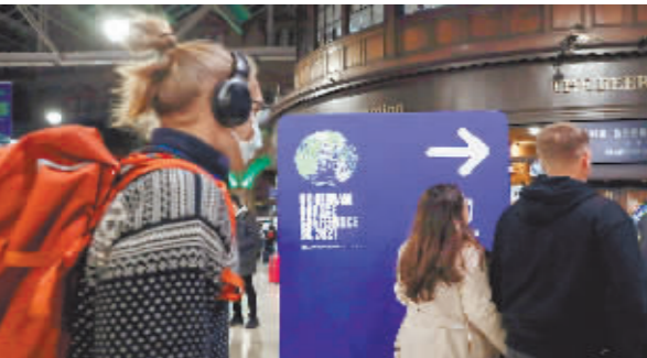
10月30日,在英国格拉斯哥中央火车站,人们从联合国气候变化大会的宣传板前走过。

2015年,《巴黎协定》在巴黎气候变化大会达成,并成为《联合国气候变化框架公约》下继《京都议定书》后第二份有法律约束力的气候协议,为2020年后全球应对气候变化行动做出安排。