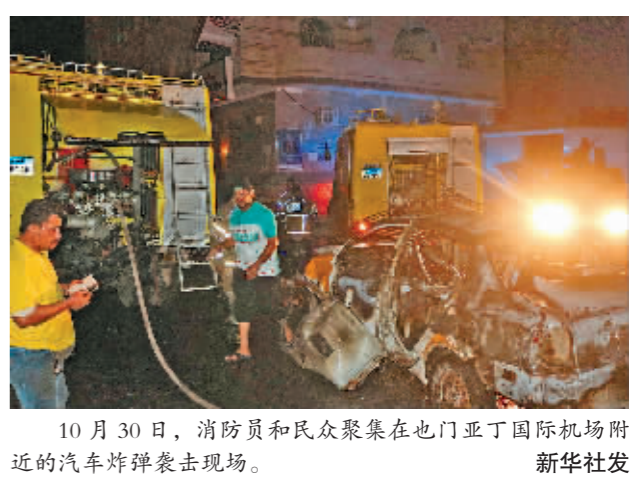
10月30日,消防员和民众聚集在也门亚丁国际机场附近的汽车炸弹袭击现场。

新华社开罗 10月30日电 也门安全部门30日说,该国南部港口城市亚丁国际机场附近当天发生一起汽车炸弹袭击,造成至少5人死亡,25人受伤。 亚丁安全部门在一份声明中说,恐怖分子当天下午在亚丁国际机场主要入口处引爆了一辆装有炸药的汽车,造成5人死亡,25人受伤,其中包括妇女和儿童,另有多辆汽车和一些建筑受损。安全部门已封锁爆炸现场,伤者被送往医院接受救治,其中多人伤势严重,死亡人数可能上升。 目前尚未有任何组织或个人宣称制造了这起袭击。亚丁安全部门说,这是一次“有预谋的恐怖袭击”。 近年来,也门内战导致国内局势混乱,“基地”组织阿拉伯半岛分支和极端组织“伊斯兰国”在也门活动频繁,多次实施恐怖袭击。