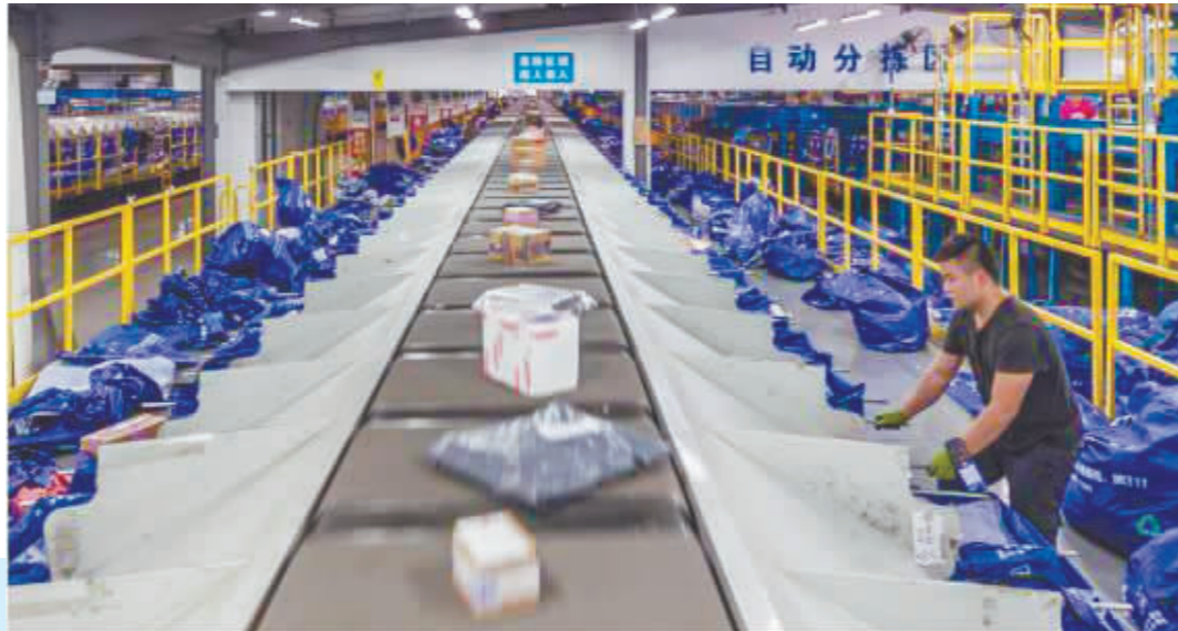
中通快递上海转运中心内自动化流水线。

记者调查发现,此前为保护用户隐私而诞生的隐私面单并没有大范围使用。这一方面是由于部分消费者在寄送快递时没有意识勾选或使用不便,另一方面,使用隐私面单也给快递员增加了额外工作量。业内人士专家表示,除了隐私面单,快递企业还需要持续加强内部信息安全管理,多管齐下才能保护好快递用户个人信息。