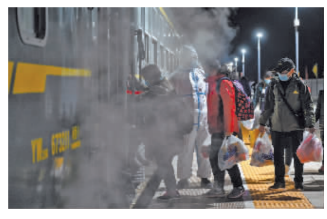
10月27日,滞留游客在额济纳站站台登上列车。

新华社额济纳旗10月28日电 10月27日,内蒙古自治区阿拉善盟额济纳旗首批滞留游客乘旅游专列返程。列车21时52分从额济纳站发车,预计于29日到达郑州。本次第一批滞留游客共有586人,其中百分之八十为60岁以上的老年人。据了解,内蒙古自治区正在制定乘坐大巴车旅行团、散客和自驾游滞留游客的转运方案,近几天滞留游客将陆续离开额济纳旗。