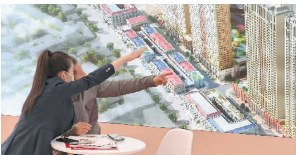
房展会上市民观看楼盘展示。