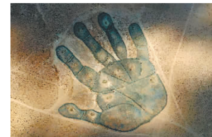
内蒙古二连浩特大手印。