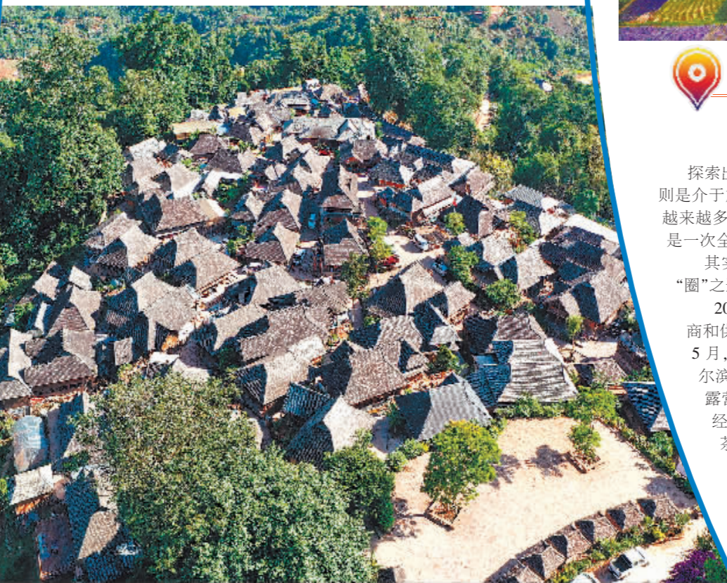
航拍景迈山翁基布朗族古村落。