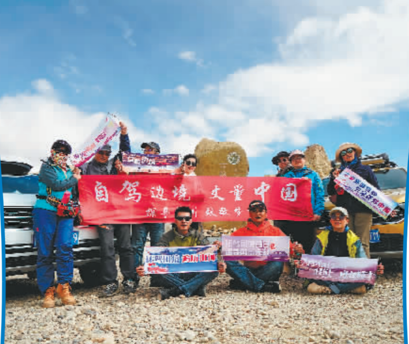
自驾车队在西藏札达县古格王国。