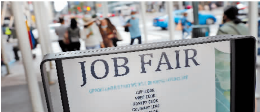
9月3日,在美国纽约曼哈顿街头的招聘启事。

这份法案由共和党推动,并已经通过该州参议院。考虑到共和党同时控制威斯康星州众议院,该法案有可能在议会两院都得以通过,最终成为法律。