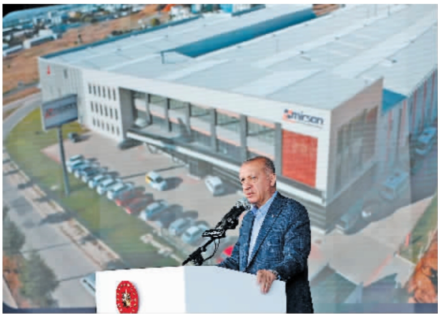
10月23日,土耳其总统埃尔多安在发表演讲。

分析人士指出,土耳其与西方国家近年来关系紧张。此番双方再度交锋,这场外交危机在西方的“服软”中收场,证明美国等西方国家干涉他国内政的霸道行为必将连连碰壁。