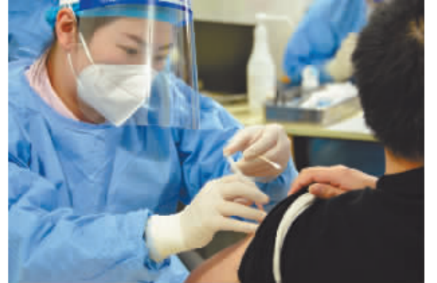
10月25日,北京市各区陆续开始组织接种过两剂疫苗的居民接种疫苗加强针,构筑免疫屏障。新华社发

新华社北京10月25日电 10月25日,在北京市新型冠状病毒肺炎疫情防控工作第247场新闻发布会上,北京市疾控中心副主任庞星火通报,2021年10月25日0时至15时,北京市昌平区东小口镇森林大第家园社区新增2例京外关联本地确诊病例,近14天累计报告2例京外关联本地确诊病例。经北京市疾控中心评估,按照《北京市新冠肺炎疫情风险分级标准》,经综合研判,北京市即日起将昌平区东小口镇森林大第家园社区定为中风险地区。