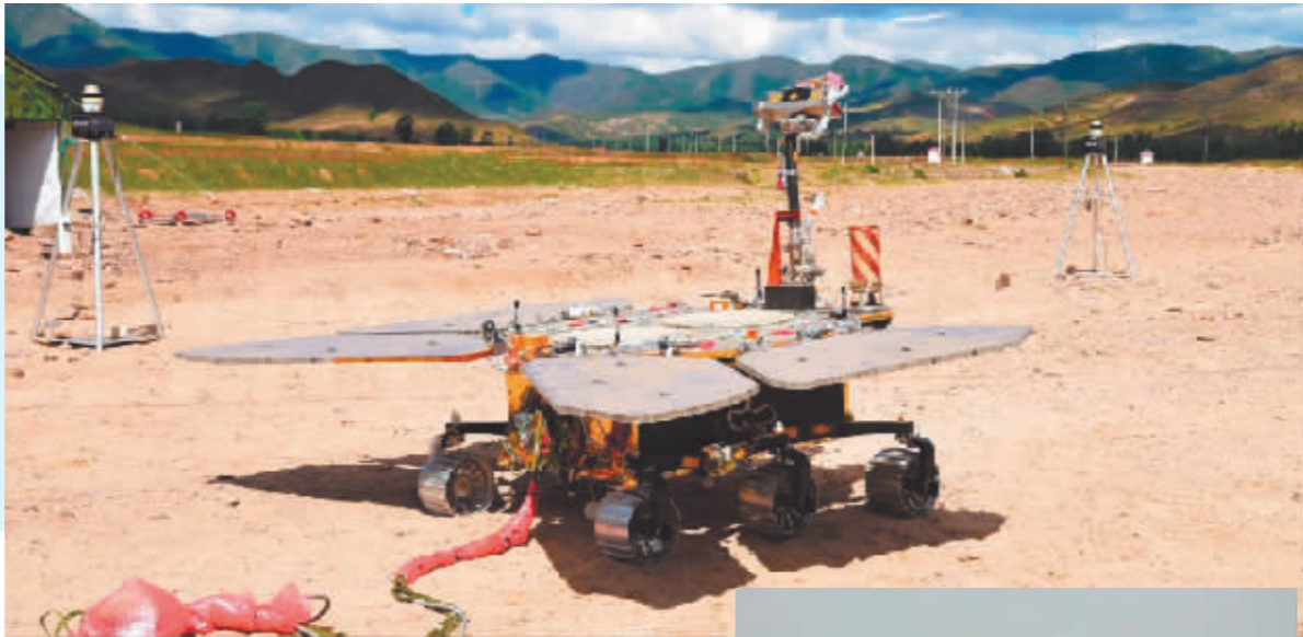
► 研制团队对火星车开展野外测试。

当火星、太阳与地球的位置不再呈一条直线,结束了日凌对地火通信的影响,与地球失联约一个月的中国首辆火星车“祝融”从4亿公里之外发回了状态正常的信号。此时北京已是深秋,乌托邦平原依然是盛夏。太阳系第四行星午后的阳光好似地球上的黄昏,“祝融”在寂寞空旷、人迹未至的星球上昂着头,浑身金灿灿的,展开四片蓝色的翅膀,它的设计者说它像地球上的蓝色蝴蝶。