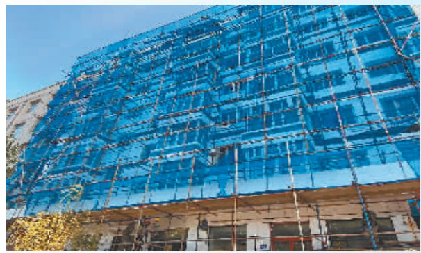
正在改造施工的老旧小区。

本报讯(张可新 律涵中 记者 郝欣)作为重点民生项目之一,今年,宾县全力推进老旧小区改造工作,各项改造施工更是抢抓工期,力争尽早让小区换新颜、让居民享福祉。