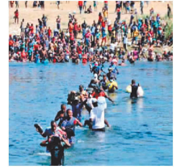
聚集在美墨边境的移民。

据新华社电 据美国媒体报道,美国执法部门2021财年在美墨边境逮捕非法移民大约170万人次,刷新2000财年创下的纪录,凸显总统约瑟夫·拜登领导的政府在打击非法移民事务上面临的压力与尴尬。