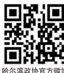
哈尔滨政协官方网站 哈尔滨政协官方微博