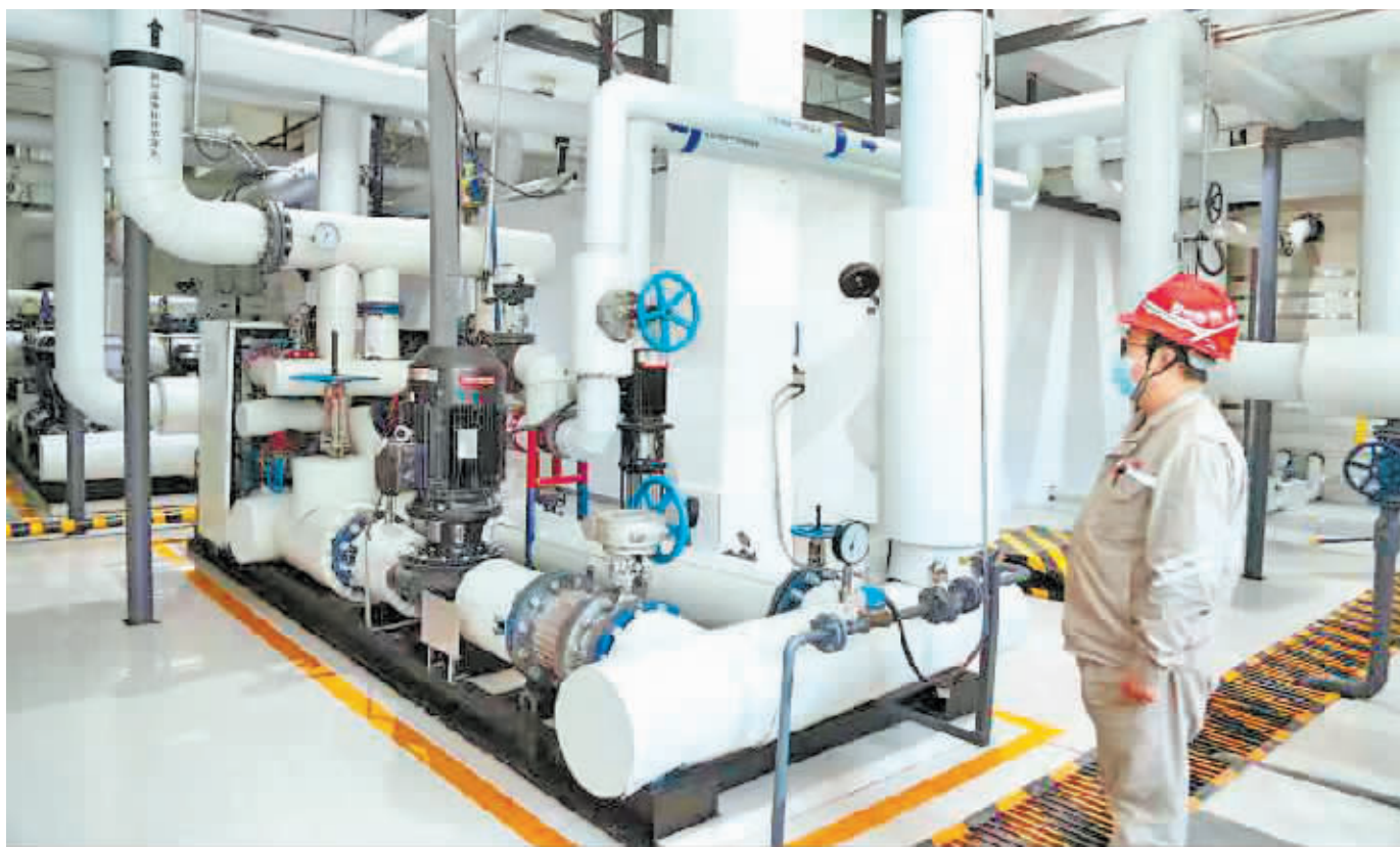
工作人员正在监控、调试供暖设备。

华电能源哈尔滨第三发电厂相关人员表示,该公司负责呼兰老城区、利民开发区、松北区等部分区域的供热。今年供热面积约2300万平方米,热用户12万户。该公司一、二级热网注水工作已全部结束,可随时按指令开栓供热。