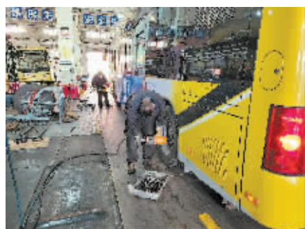
工作人员正在对车辆轮胎等进行检修。