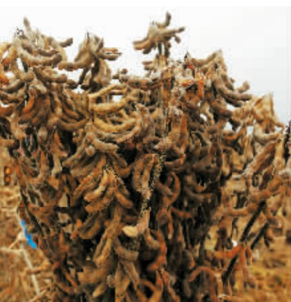
示范区“黑农”大豆丰收。

本报讯(王红蕾 记者 王辛娜)近日,黑龙江省农业科学院组织专家组对“黑农84”等5个“黑农”品种示范区实测,经过专家现场测产,5个品种平均亩产量为263.4公斤,“黑农”大豆品种续写丰收。