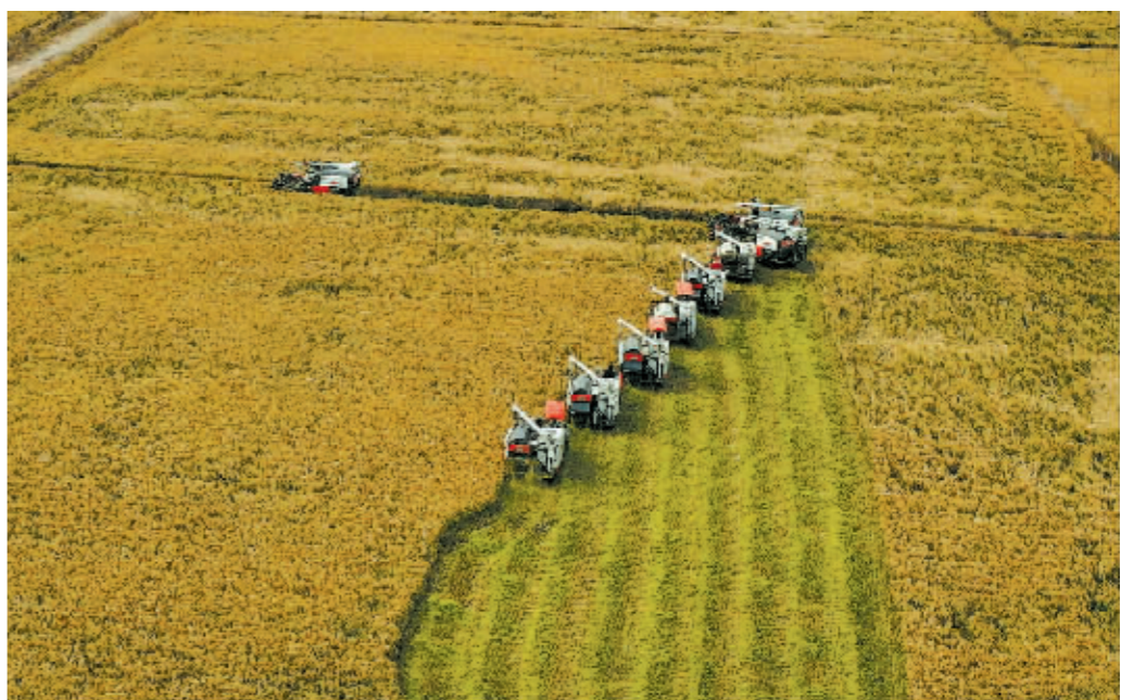
收割机在稻田里穿梭。