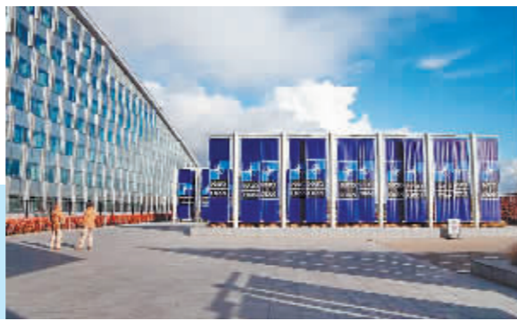
左图:在比利时布鲁塞尔的北约总部。 右图:2018年3月14日,英国宣布驱逐23名俄罗斯外交官,以报复俄罗斯涉嫌参与发生在英国的俄前特工中毒事件。图为俄罗斯驻英国大使馆。

北大西洋公约组织官员6日说,俄罗斯常驻北约代表团8名成员是“情报人员”,北约已撤销这8人的常驻资格,并再次削减俄代表团人员编制,从20人减至10人。 俄罗斯外交部副部长亚历山大·格卢什科同日回应说,这是北约散布所谓“俄罗斯威胁”的又一举动。