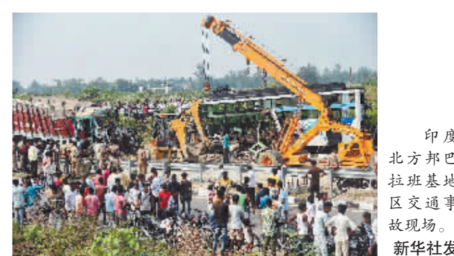
印度北方邦巴拉基地区交通事故现场。

新华社新德里10月7日电 印度警方7日说,印度北部当天发生一起重大交通事故,一辆来自首都新德里的客车在北方邦巴拉基地区与一辆迎面驶来的卡车相撞,造成至少10人死亡、25人受伤。警方说,伤者已被送往当地医院接受治疗,其中一些伤者伤势严重,死亡人数可能还会上升。 因道路状况恶劣和驾驶员超速、超载等违规操作,印度交通事故频发。据不完全统计,印度每年约有15万人死于交通事故。