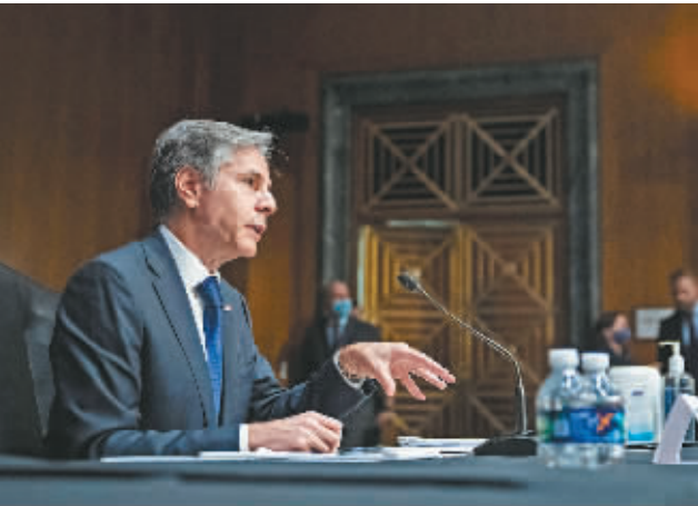
9月14日,美国国务卿布林肯在华盛顿出席国会听证会。

分析人士认为,法美在外交理念和利益上存在分歧,过去就多有齟齬,近年来华盛顿奉行“美国优先”,与巴黎的“欧洲战略自主”更加无法兼容。“旧怨”加“新伤”,双方深层矛盾很难通过几次外交访问或口头示好就得到解决。