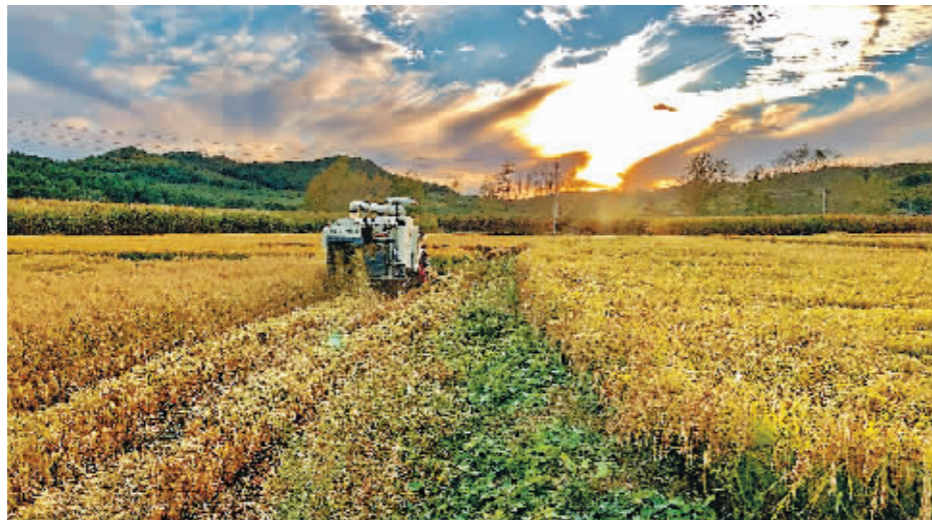
农民抢抓农时加快秋收。

烘干设备,备好粮食储存设备。二是要做好科学收获,做到因地制宜,适时抢收快收、人机齐上、能收尽收;充分发挥农机合作社、农机大户的作用,以机为主,以人为辅,