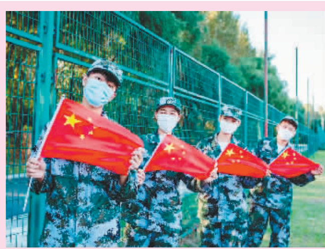
哈尔滨商业大学学生们在校园里合影,“手中挥动着五星红旗,心中洋溢着作为一个中国人的自豪。”