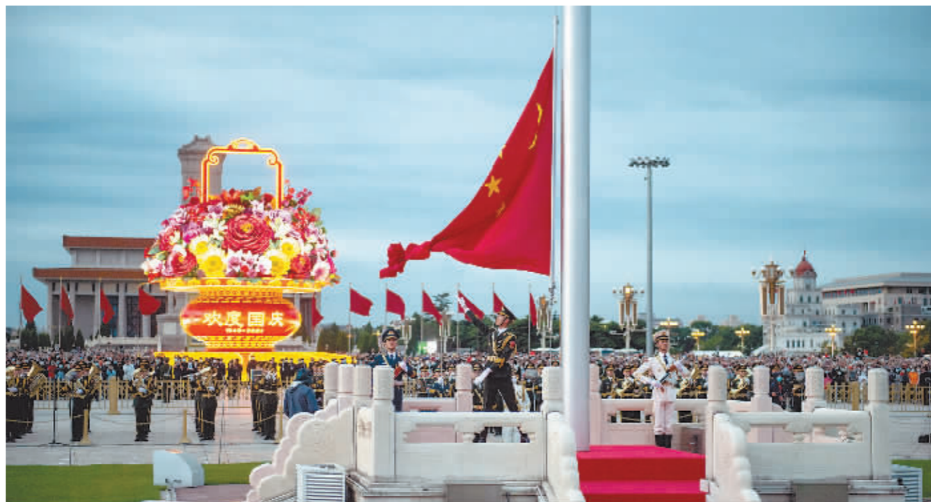
10月1日清晨,隆重的升旗仪式在北京天安门广场举行,庆祝中华人民共和国成立72周年。

10月1日6时,首都北京天安门广场,微风拂过。十余万名群众会聚于此,等待着五星红旗冉冉升起,共同庆祝中华人民共和国72华诞。