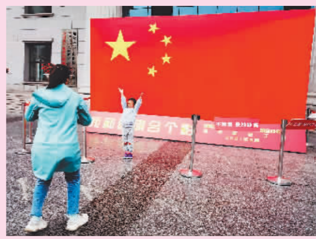
为祖国庆生与国旗合影!市民在“我和国旗合个影”背景板前拍照。柏凡露本报记者梁可心摄