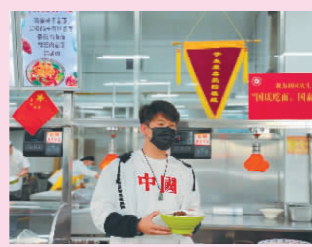
同吃一碗“国庆面”共唱一曲爱国歌!冰城大学生用独特方式庆祝祖国生日。刘元昊李晟睿本报记者王越摄