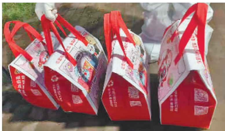
30份爱心奶茶送到核酸采集点。