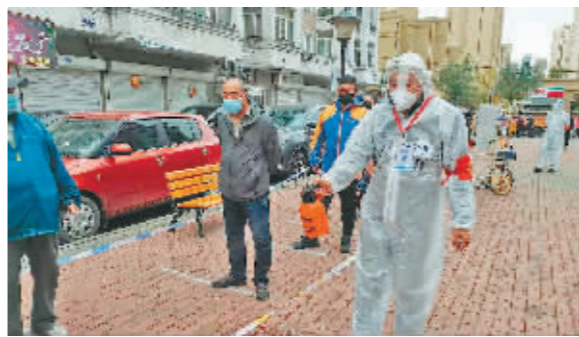
老吴给核酸采集点消毒。