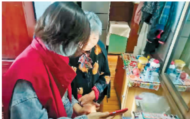
志愿者帮助老人与亲人用视频连线的方式见面。

本报讯(记者 梁可心)烽火连三月,家书抵万金。为及时传达家人之间的隔空关怀,平房区保国街道东升社区“家门口”志愿服务站对外埠游子、居家隔离等人员暖心开展“您的家我来照看”志愿服务。