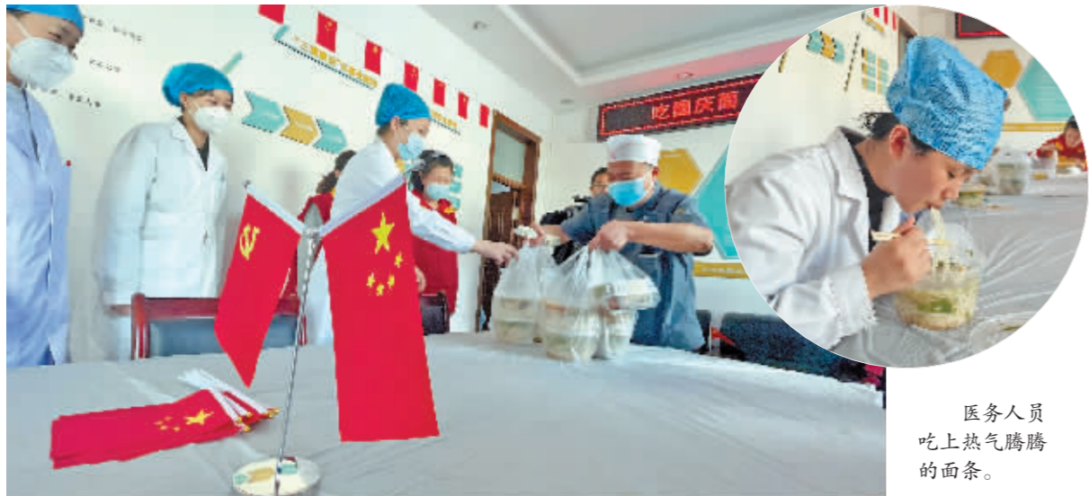
医务人员吃上热气腾腾的面条。

本报讯(孙娅 吕建军 记者 刘姝媛/文)29日中午,25份热气腾腾的面条从一家面馆后厨端了出来,送到了道里区抚顺社区。“疫情防控期间,社区人员太辛苦了,吃不上热乎饭,我们尽点微薄之力。”面馆老板说,快过节了,吃面条给祖国庆生,感谢所有默默奉献的工作人员。在国庆节来临之际,道里区组织开展“国庆吃面国泰民安”新民俗活动,倡导市民群众吃国庆面,为祖国庆生。同时,也号召社会餐饮企业为因疫情集中隔离、居家隔离市民和在疫情防控一线的工作人员送上热气腾腾的国庆面,“一碗暖心面一份爱国情”,祝福祖国国运绵长,国泰民安。