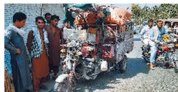
9月25日在阿富汗爆炸袭击中受损的三轮车。

新华社喀布尔9月25日电 阿富汗东部楠格哈尔省首府贾拉拉巴德25日发生爆炸事件,造成1人死亡、7人受伤。