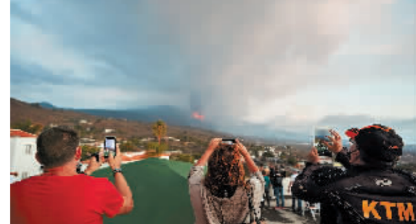
9月23日,人们在拉帕尔马岛观看火山喷发。

新华社北京9月26日电 西班牙拉帕尔马岛老昆布雷火山喷发加剧,岛上机场25日关闭。不少人因航班取消改乘渡轮,渡轮码头排起长龙。