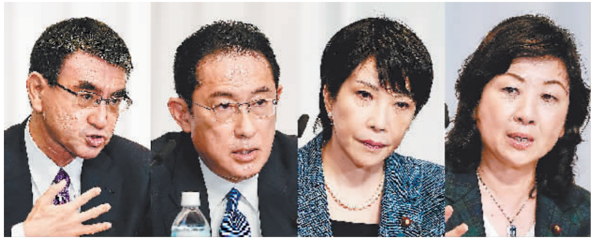
9月17日,在日本东京,日本自民党总裁选举候选人河野太郎、岸田文雄、高市早苗和野田圣子(从左至右)在竞选演讲之后的记者会上。

日本执政党自由民主党总裁选举进入“决战期”之际,多家日本媒体联合实施的一项最新民调显示,行政改革担当大臣河野太郎获得45%调查对象支持,在4名候选人中处于领先地位。不过,考虑到自民党总裁选举投票规则,河野的高人气并不意味着他稳操胜券,选情仍有不确定性。