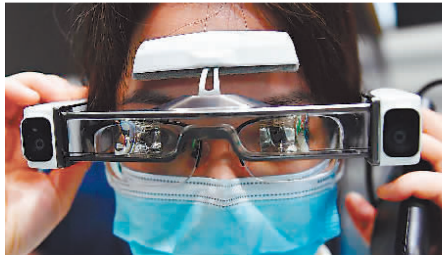
9月25日,浙江乌镇,一名参观者体验VR(虚拟现实)眼镜。

千年古镇,温婉优雅,枕水人家的木门徐徐打开,2021年“乌镇时间”如约而至。9月26日,以“迈向数字文明新时代——携手构建网络空间命运共同体”为主题的2021年世界互联网大会乌镇峰会在浙江桐乡乌镇开幕。