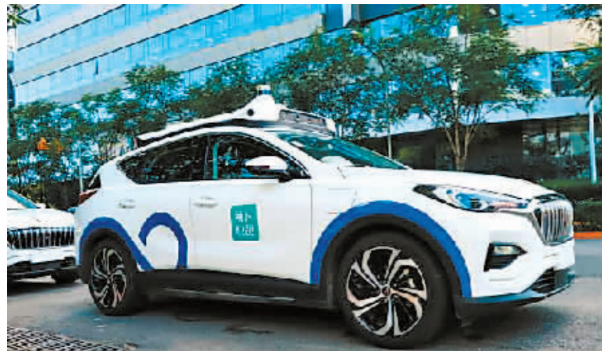
百度无人车出行服务平台“萝卜快跑”车辆。

手机点一点,网约车如约而至,乘客一看,这是一辆无人驾驶汽车;出行导航,车道路面3D实景还原,实现“沉浸式”导航体验……随着自动驾驶、人工智能、大数据等技术推进,人们对智慧出行的若干畅想正不断变成现实。