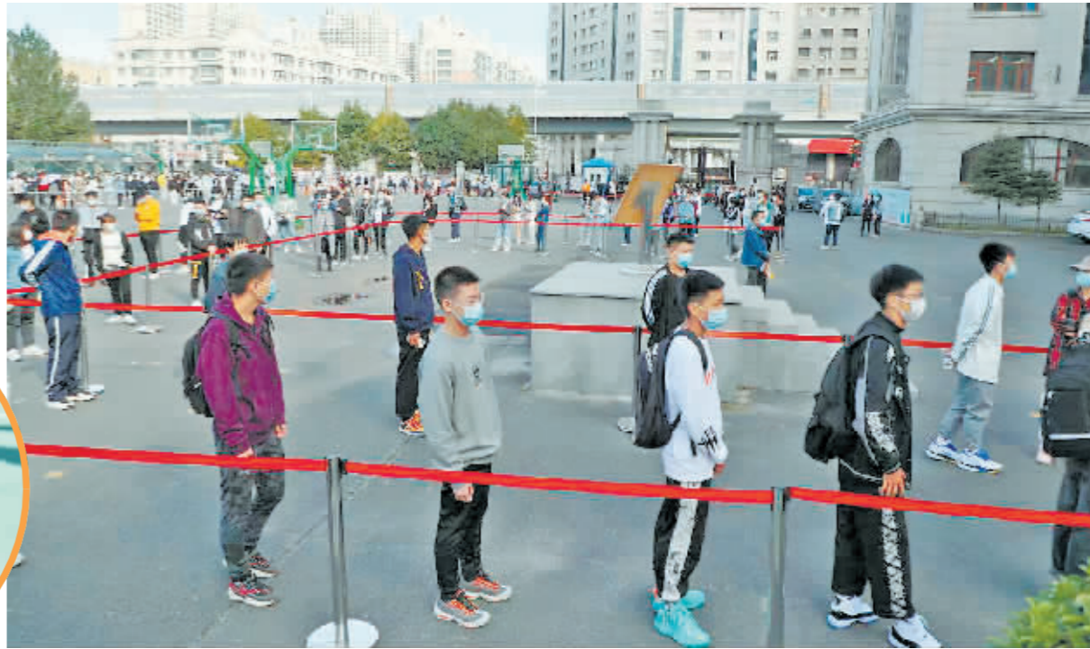
市民间隔1米,有序排队。