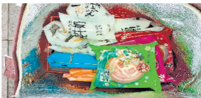
女孩送来的热牛奶和月饼。