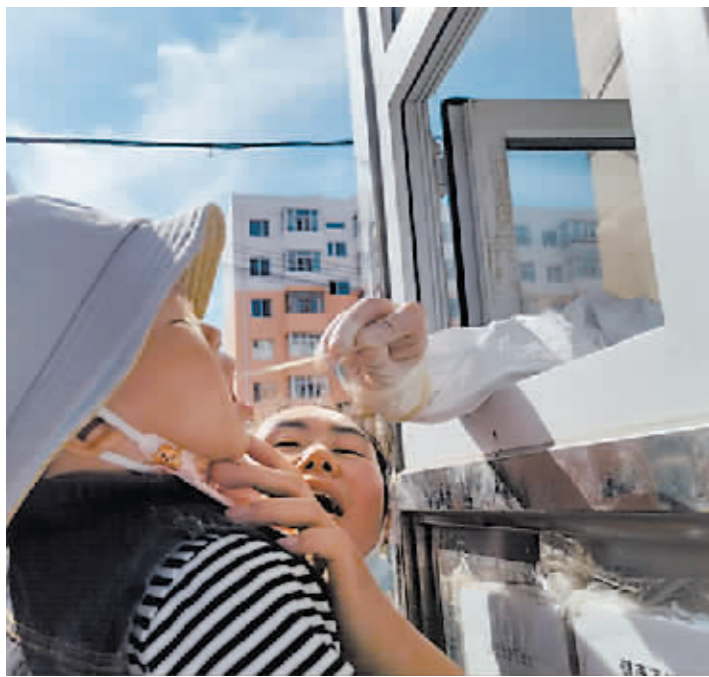
20个月的小朋友配合采集,还对护士阿姨说“谢谢”。