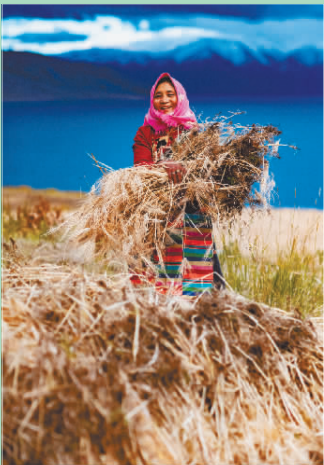
23日，西藏那曲市尼玛县文部乡文部村村民开镰收割。