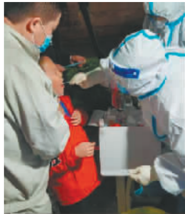
现场采集核酸样本。

结束工作,脱下防护服的她们,双手已冻得麻木,但她们的脸上却洋溢着笑容。“虽然寒冷,却体会到居民温暖的心,采了多少份核酸样本,