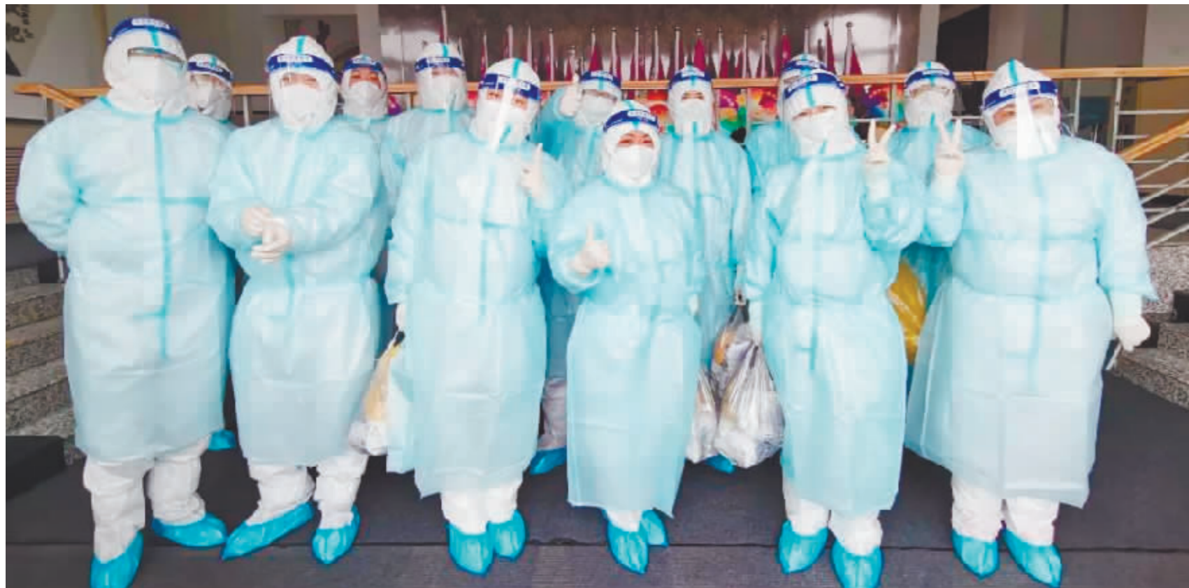
出征“疫”线的黑龙江中医大二院医护人员斗志昂扬。

当抗击疫情的集结号在中秋节吹响时,冰城医务工作者放下手中团圆的碗筷,整理行装立即出发。一声令下,迅速集结。冰城的白衣天使们再次奔赴“疫”线,在各个核酸采集点到处可见他们的身影,衣衫被汗水浸透,护目镜满是水汽,他们毫无怨言牢牢筑起疫情防控安全线。