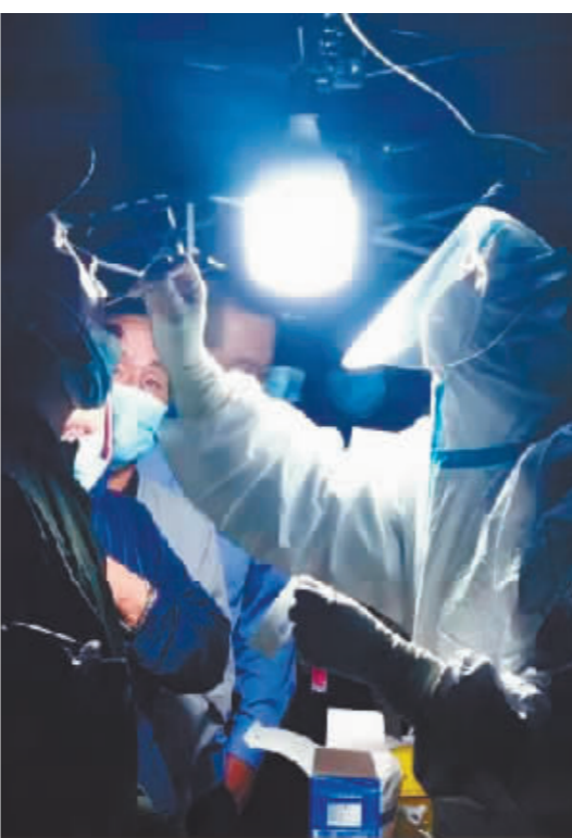
医护人员连夜为居民采集核酸样本。

医院内一批留守人员也在奋战。体检科24小时接收社区卫生服务中心及隔离宾馆核酸样本,检验科工作人员在PCR实验室机器不停人不休,连续开展检测工作……各业务科室人员坚守岗位践初心、尽职尽责担使命,用实际行动参与疫情防控,甘做守护人民生命安全、默默奉献的白衣天使。