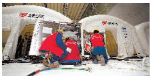
新冠肺炎疫情感染者。在紧张的疫情防控氛围中,国网哈尔滨供电公司党员闻令而动,“战疫情,守冰城”防疫保供电工作全面铺开。

9月21日,哈尔滨市应对新冠肺炎疫情工作指挥部发布第28号公告,哈尔滨市发现本土新