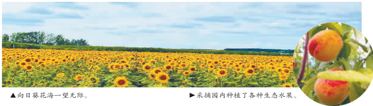
▲向日葵花海一望无际。

旅游资源,利用三年时间,把名不见经传的杏林村打造成哈尔滨人的“北胜地”。 目前,杏林村各旅游项目均已落成投入使用,形成较为完备的旅游产业链条,近三年总计接待游客5.8万人次,村民人均年收入达到25000元,人均收入比以前提高38%。