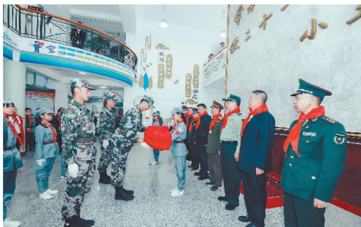
全国红军小学建设工程理事会向苏宁红军小学转赠曾飘扬在天安门广场的国旗。

活动现场,全国红军小学建设工程理事会向苏宁红军小学转赠曾飘扬在天安门广场的国旗。