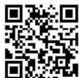
详细内容 请扫码观看

从出发到抵达,从抢修到供电,充满困难和挑战,但奋战在一线的共产党员服务队始终践行着“人民电业为人民”的企业宗旨,圆满完成抢修任务。