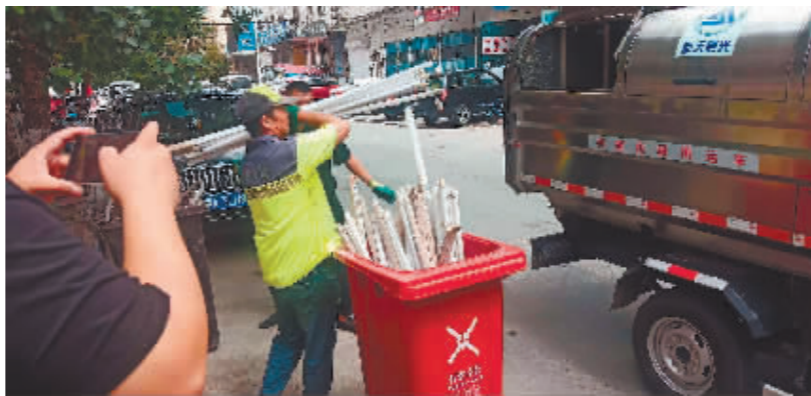
专车收运有害垃圾。

本报讯(记者 霍亮文/摄)为切实解决全区居民积攒下来的过期化妆品、灯管、油漆桶等有害垃圾,近日,道里区垃圾分类办工作人员带领专门转运车辆到正阳河街道办事处河阳街48号有害垃圾暂存点,点对点上门收运有害垃圾。此次收集活动,也标志着道里区城管局“我为群众办实事、有害垃圾上门收”便民活动正式拉开序幕。