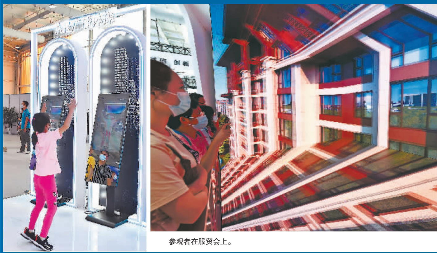
参观者在服贸会上。

参加服贸会的各领域专家纷纷表示,包括金融业在内的我国服务业和服务贸易开放发展还将向更多领域、更深层次推进。与会嘉宾认为,数字技术发展将进一步推动贸易方式和贸易对象的数字化,激发服务贸易和服务业合作发展的巨大市场空间,为世界经济复苏带来新动能。