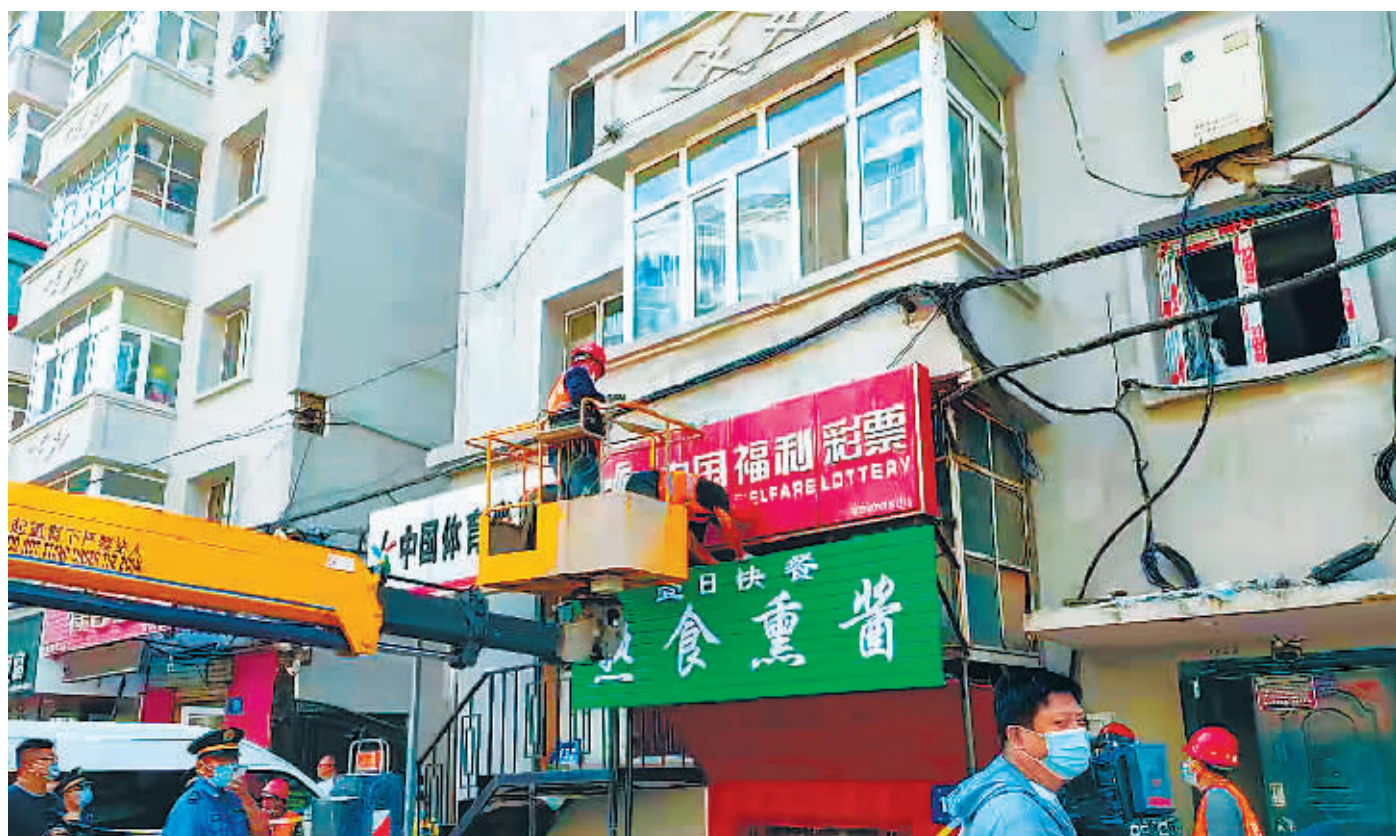
执法人员拆除违规牌匾。

在北安街130-1号门前,记者看到彩票站的门前设置了两块牌匾,执法人员说,这种牌匾属于一店多匾,违规设置,影响了市容市貌。执法人员将对多出的牌匾进行拆除。随后执法人员来到北安街11号“鑫源摩托车”门前,执法人员正在切割牌匾的钢架体。按规定,商家不允许设置彩钢条材质,字体有外露点光源的牌匾。本次牌匾治理将对带有广告性质(如经营项目、电话号码)的牌匾、一店多匾、废弃牌匾、牌匾混乱、占用公共空间等违规行为进行严格整治。经执法人员前期普查,目前该街路存在违规问题的牌匾共有66块,执法人员将分成两组,在街路两侧同时推进,力争在最短的时间内将违规牌匾整治完毕。