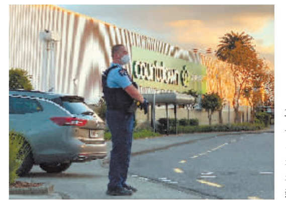
9月3日,警察在奥克兰发生恐袭的超市外警戒。

新华社北京9月5日电 新西兰最大城市奥克兰一家超市3日发生持刀行凶案,造成7人受伤。总理杰辛达·阿德恩4日宣布,将从今修订反恐法律,弥补漏洞。