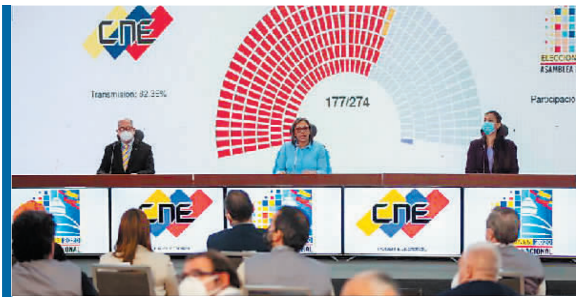
2020年12月7日凌晨,委内瑞拉国家选举委员会主席英迪拉·阿方索(台上)宣布,执政党联盟赢得议会选举胜利。