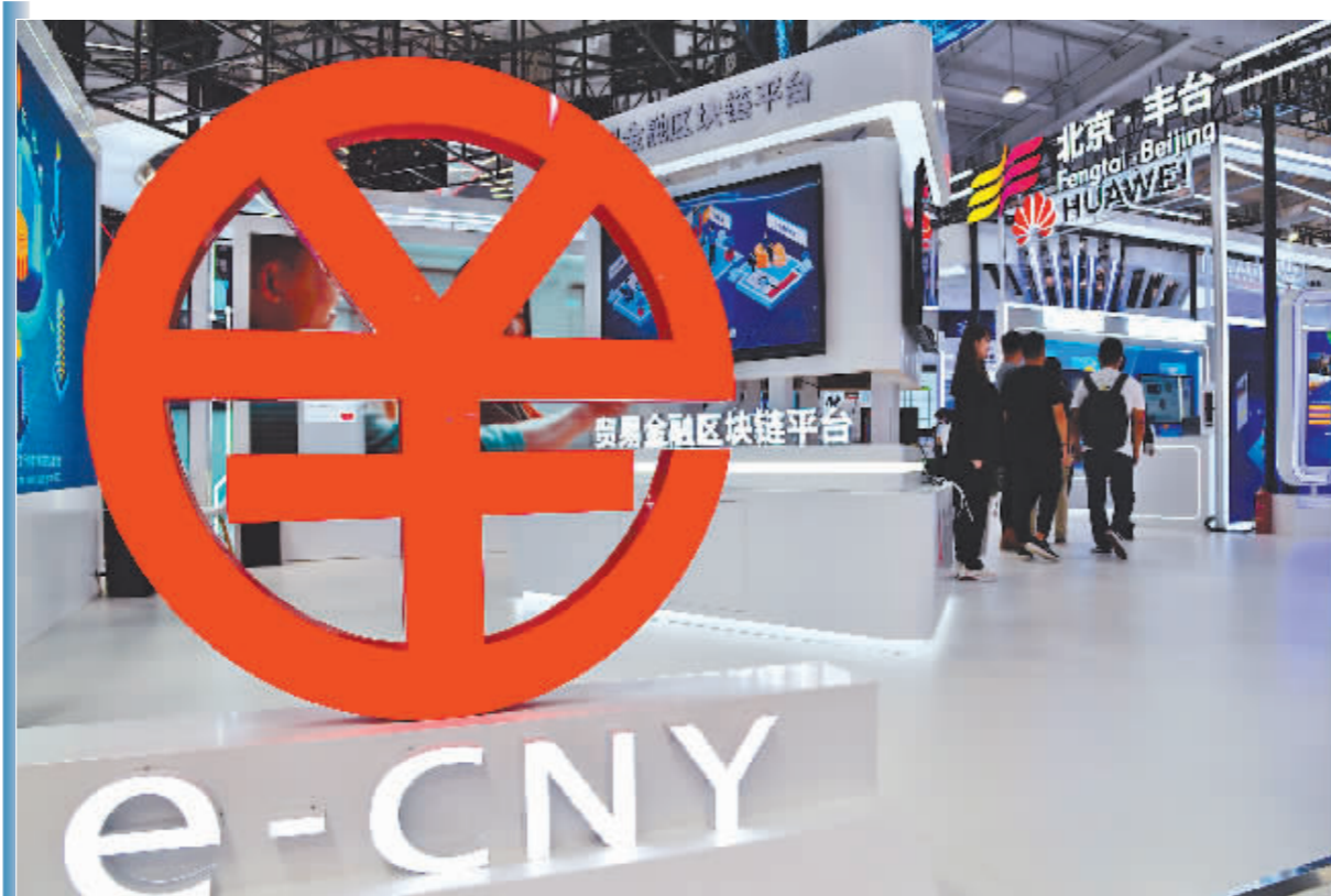
这是9月4日在服贸会首钢园区金融服务展馆拍摄的中国人民银行数字货币研究所展台。

再比如手表钱包,可满足冬季运动时便捷支付的需求,在滑雪场或滑冰场,运动员、游客戴着手表,轻轻一碰就可完成数字人民币支付。