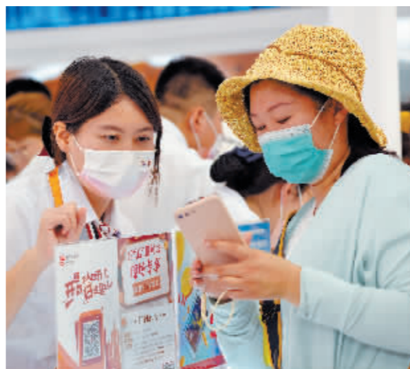
9月4日,一名参会者(右)在服贸会首钢园区金融服务展馆中国银行数字人民币展区咨询办理业务。