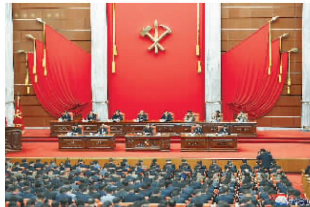
9月2日在平壤举行的朝鲜劳动党第八届中央委员会第三次政治局扩大会议现场。

新华社平壤9月3日电 据朝中社3日报道,朝鲜劳动党总书记金正恩在2日举行的一次政治局扩大会议上要求进一步加强国家性防疫措施,以应对全球卫生危机不断扩散带来的危险局面。 报道说,金正恩在劳动党第八届中央委员会第三次政治局扩大会议上强调,所有党组织和干部必须重新检查国家防疫体系和本部门的工作,集中展开政治攻势,保持高度警惕,使防疫战线再次紧张起来。各级部门要充分巩固防疫工作所需的物质基础,提高防疫部门人员的专业水平,进一步完善朝鲜防疫体系。 为防止新冠疫情输入境内,朝鲜2020年1月下旬开始关闭边界,并采取严格的管控措施,国内迄今为止没有发现一例新冠病毒确诊病例。