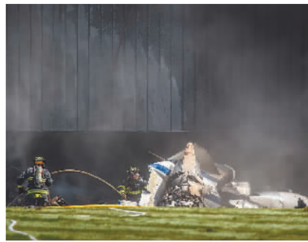
9月2日,一架“塞斯纳”小型飞机在美国康涅狄格州法明顿坠毁,机上4人全部死亡。图为9月2日,消防员在美国康涅狄格州法明顿的飞机坠毁现场工作。